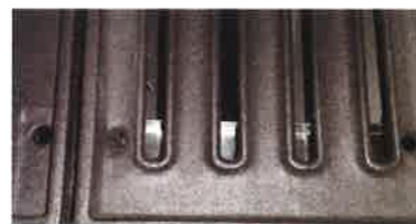
NUOVE GRIGLIE scanalate in ghisa vetrificata con sistema raccolta grassi