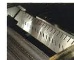
SISTEMA RIVOLUZIONARIO di diffusione del calore