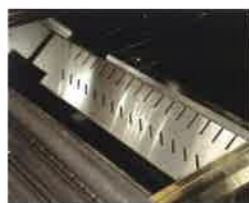
SISTEMA RIVOLUZIONARIO di diffusione del calore