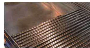
PIANO COTTURA IN ACCIAIO INOX 304